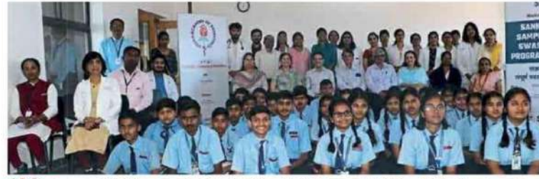
नंदी हिल्स : एसएमबीटी मेडिकल सायन्सेस अॅन्ड रिसर्च सेंटर येथे प्रशिक्षणात सहभागी प्रियदर्शनी इंटरनॅशनल स्कूलचे विद्यार्थी.

बाल आणि पौगंडावस्थेतील मुले निरोगी रहावीत, त्यांचा सर्वांगीण विकास व्हावा यासाठी नंदी हिल्स येथील प्रियदर्शनी इंटरनॅशनल स्कूलमध्ये निरोगी कसे राहावे याचे धडे देण्यात आले. भारतीय बालरोगतज्ज्ञ संघटना आणि एसएमबीटी मेडिकल कॉलेज 'संकल्प : संपूर्ण स्वास्थ्य' अंतर्गत १०० वेगवेगळ्या शाळांमधील विद्यार्थ्यांना निरोगी आरोग्याचे धडे दिले जात आहेत. याप्रसंगी एसएमबीटी मेडिकल कॉलेजच्या