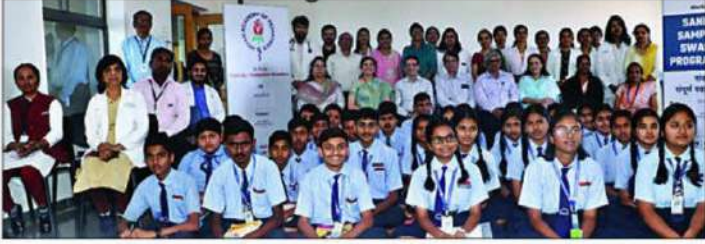
नाशिक : 'संकल्प: संपूर्ण स्वास्थ्य' अंतर्गत निरोगी आरोग्याचे धडे घेतेवेळी विद्यार्थी.